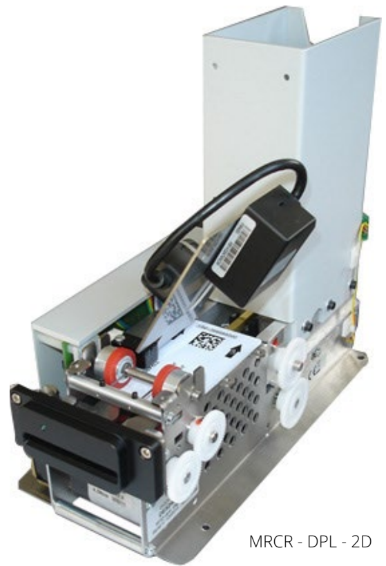
MRCR - DPL - 2D