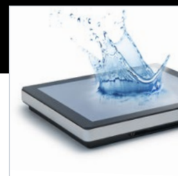
Norme IP 65